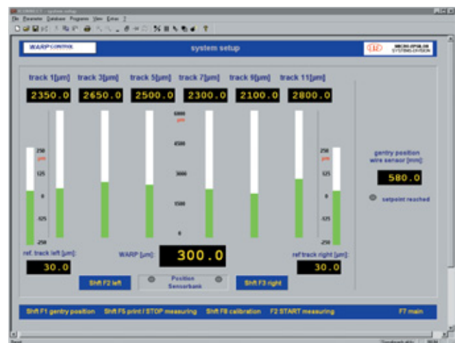
Abb. 2 Messprotokoll