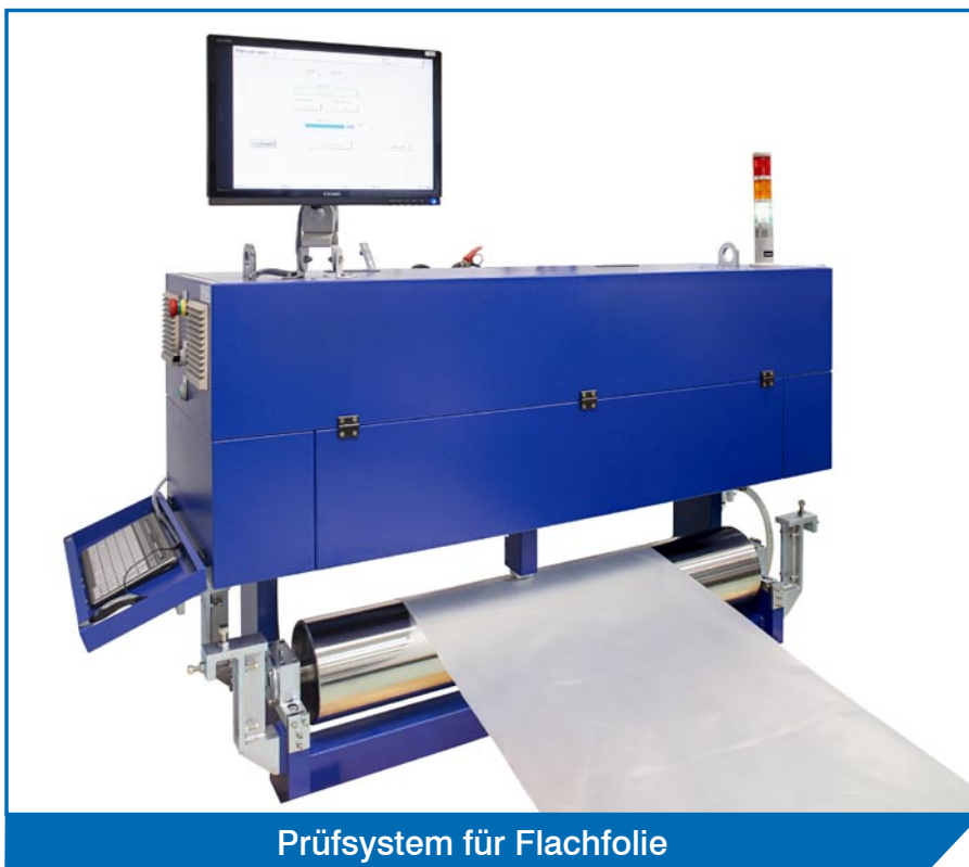
Prüfsystem für Flachfolie