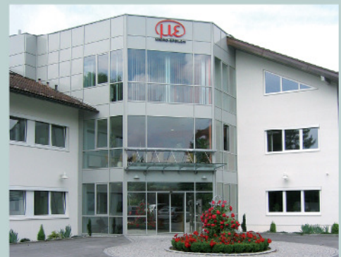
Das Hauptgebäude des Firmensitzes

Die Sensoren von Micro Epsilon kommen in Forschung und Entwicklung, in Prüfständen, in Fertigungsstraßen oder direkt in Maschinen oder Prüfanlagen im Einsatz. Die Produktpalette umfasst induktive Sensoren, Lasersensoren, konfokal-chromatische Sensoren, kapazitive Sensoren, Wirbelstromsensoren, Bildverarbeitungssysteme, Temperatursensoren, Prüfanlagen und OEM-Sensoren. Das Unternehmen in Ortenburg bei Passau kann Kunden mit Aufträgen für geringe Stückzahlen bis hin zu großen Serienproduktionen beliefern.