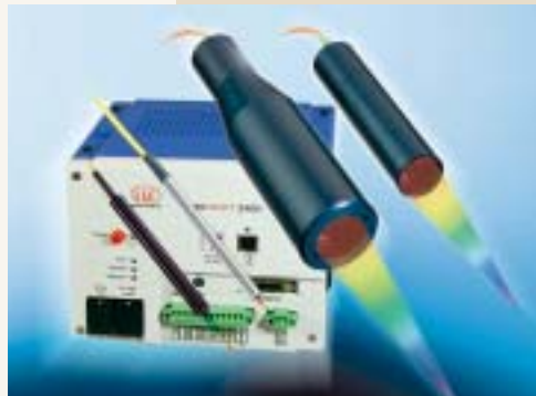
Konfokale Sensoren erfassen bei der Messung Weg, Abstand und Position.

Weißes Licht gelangt durch einen halbdurchlässigen (semipermeablen) Spiegel auf die Linse. Die Wellenlängen werden von der Oberfläche eines Targets reflektiert und gelangen über die Linse zurück auf den semipermeablen Spiegel. Der Spiegel lenkt die Wellenlängen auf eine Lochblende, welche die am besten fokussierten Wellenlängen mit der höchsten Intensität durchlässt. Unscharfe Spektren treffen an der Lochblende als Scheibchen auf und nicht als fokussierter Punkt. Die fokussierte Wellenlänge besitzt genügend Intensität, um auf der CCD-Zeile einen signifikanten Peak zu erzeugen. Nach der Lochblende wertet ein Spektrometer die erhaltene Farbinformation aus. Darin befindet sich ein optisches Gitter, das je nach Wellenlänge eine mehr oder weniger starke Ablenkung der Wellenlänge auf eine CCD-Zeile erzielt. Jede Position auf der CCD-Zeile entspricht einem bestimmten Abstand des Targets zum Sensor. Man erhält 30\,000 aufgelöste Punkte über die Tiefenschärfe (Messbereich). Für die Signalgewinnung wird nur die Wellenlänge ausgewertet. Egal, wieviel Licht von einem Objekt reflektiert wird, eine Abstandsinformation kann fast immer gewonnen werden, da jede fokussierte Reflexion zu einem mehr oder weniger hohen Peak führt, solange das reflektierte Licht stärker ist als das Grundrauschen. Mit dem konfokalen Messprinzip kann auf hoch reflektierenden Materialien genauso zuverlässig gemessen werden, wie auf schwarzem Gummi oder auf transparenten Stoffen.