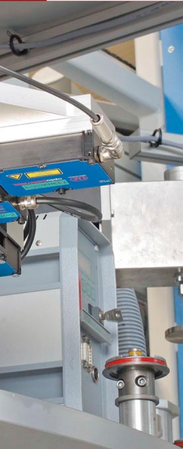
Laser-Mikrometer Typ ODC 2600-40 von Micro-Epsilon Eltrotec messen von Spalte und Durchmesser. Alle Sensoren lassen sich auf die jeweilige Anwendung kalibrieren und kundenspezifisch an die Messaufgabe anpassen

mm. Sende- und Empfangsoptik sind durch kratzfestes Glas geschützt. Die Optik entspricht IP 67, die Elektronik IP 65. In der Spalt- und Kantenmessung lässt sich der Sensor zur Spurverfolgung, zur Positionsbestimmung oder auch zur Breitenmessung von laufenden Bahnen einsetzen. Mögliche Materialien sind Gummi, nicht transparente Folien, Papier, Textilien, Kunststoffe sowie Metalle und Bimetalle.