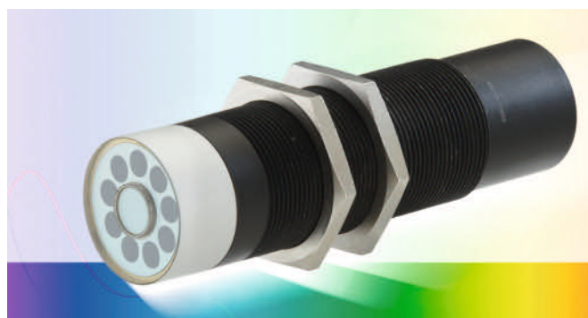
Bild 3. Matte Oberflächen: Der Sensor funktioniert per Festoptik und erkennt daher die Farbe aus großem Abstand.