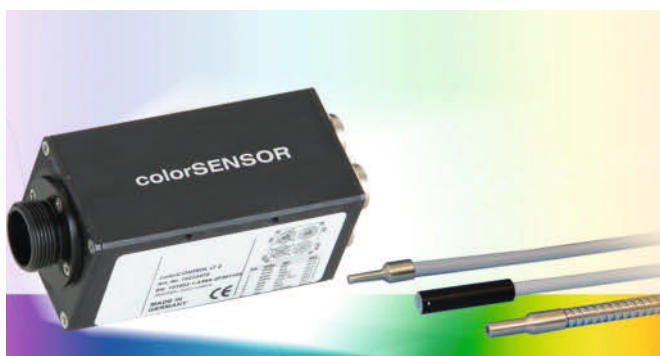
Bild 2. Universelle Farbprüfung: Bei diesem Sensor wird der Lichtleiter direkt zum Objekt geführt.