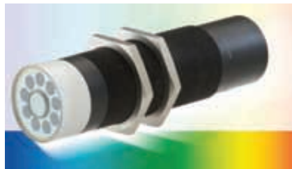
Oben links: »colorSENSOR OT« Sensoren funktionieren per Festoptik und können daher aus großem Abstand die Farbe erkennen. Der abgebildete »colorSENSOR OT-MA« wird für matte Oberflächen eingesetzt.

Farbsensoren ist breit gefächert und reicht von der Farbprüfung in der Teile-Eingangskontrolle über die Farb- und Druckmarkenerkennung bis hin zur Oberflächeninspektion. Und in all diesen unterschiedlichen Applikationen sind absolute Meister ihres Faches, sprich auf bestimmte Aufgaben spezialisierte Sensoren, gefragt. Das entsprechende Angebot von Micro-Epsilon umfasst eine große Auswahl an Farbsensoren der Serie »colorSENSOR« bis hin zum messenden, online einsetz-