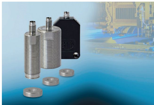
Bild 5: Bei Magneto-induktiven Sensoren wird der Messbereich mit dem verwendeten Magneten festgelegt. Bis zu 55 mm sind möglich.

Controller und dazu passende neuartige Sensoren. Das Gehäuse des Controllers mit Hutschienenhalterung ist aus massivem Alu gefertigt und in IP 65 ausgeführt. Das Gerät selbst weist keinerlei Bedienelemente auf. Alle Einstellungen sind per Ethernet-Schnittstelle betriebssystemunabhängig über einen Browser zu treffen, so dass keine gesonderte Software nötig ist. Die neue Serie dient als Universal-Gerät in der Wirbelstromtechnik. Der einfache Sensortausch ist in jeder Anwendung wichtig, bei der verschiedene Sensoren mit unterschiedlichen Messbereichen auf verschiedenen Targetmaterialien eingesetzt werden, wie in F+E, Universitäten, Labore oder Instituten.