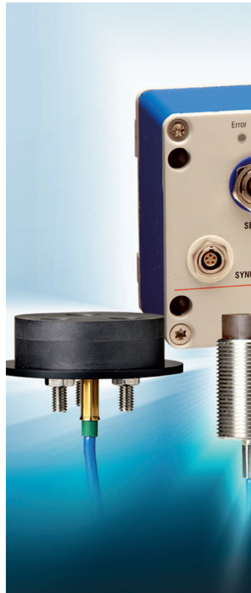
Bild 2: Die Embedded Coil Technology verhilft Wirbelstromsensoren zu neuen Anwendungen mit extremen Einsatzanforderungen an mechanische Stabilität oder Einsatztemperatur.