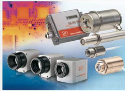
Sensoren und Messgeräte für berührungslose Temperaturmessung